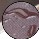
PLATEFORME D'ALUMINIUM ET CONTREPLAQUÉ ANTIDÉRAPANT DE 5/8" AVEC EMBOUT D'EXTRÉMITÉ