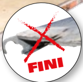
PLATEFORME D'ALUMINIUM AVEC EMBOUT D'EXTRÉMITÉ