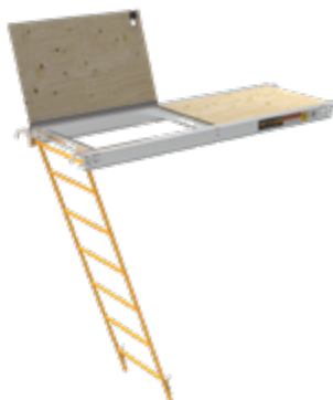
PLATEFORME AVEC TRAPPE D'ACCÈS ET ÉCHELLE