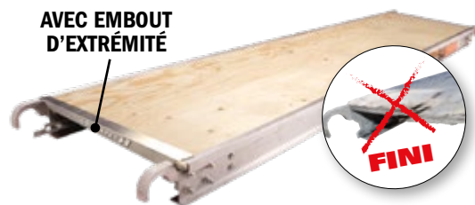
AVEC EMBOUT D'EXTRÉMITÉ