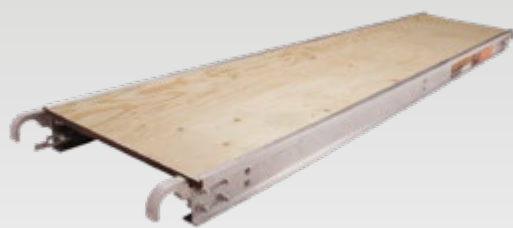
PLATEFORME D'ALUMINIUM ET CONTREPLAQUÉ DE 5/8"