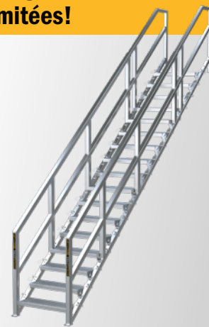
17 À 21 MARCHES