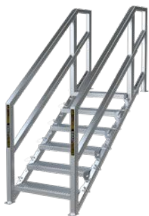
6 À 10 MARCHES