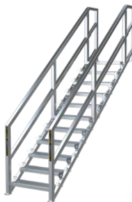
11 À 16 MARCHES