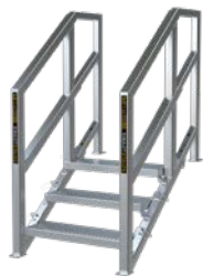
3 À 5 MARCHES

Les escaliers Smartstairs™ peuvent être configurés selon vos besoins, les possibilités sont illimitées!