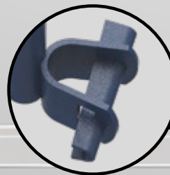
ATTACHE À CALE

100% COMPATIBLE AVEC LE MODÈLE À 4 CROCHETS