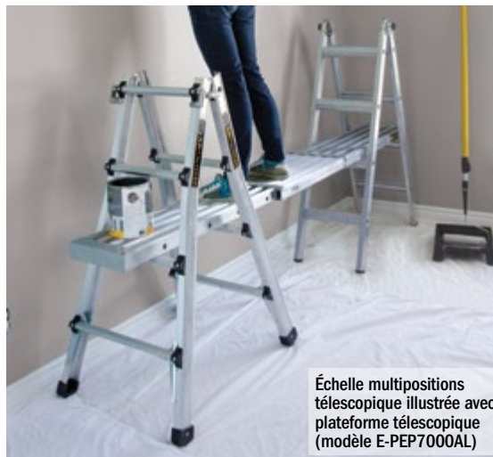
Échelle multipositions téléscopique illustrée avec plateforme télescopique (modèle E-PEP7000AL)